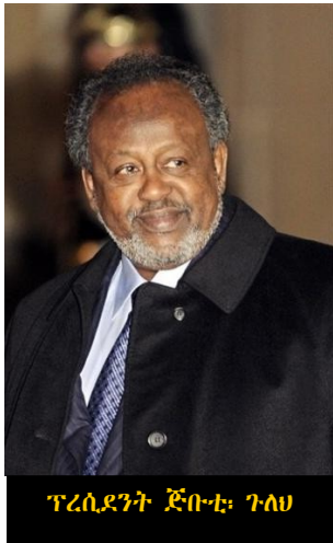
ፕረሲደንት ጅቡቲ፡ ጉላህ

ፕረሲደንት ጅቡቲ፡ ኢስማኢል ሶማር ጉላህ፡ ወትሃደራት ጅቡቲ ኣብ ሓደገኛ ተፋጠጥ ምስ ወትሃደራት ኤርትራ ከምዘለው ገሊጾም ክብል ኣብ ሃገረ ፈረንሳ ዝመደበሩ ኣጃጃስ ፍራንሲስ ፕረስ ተባሂሉ ዝፍለጥ ማዕከን ዜና ትማሊ ገሊጹ።