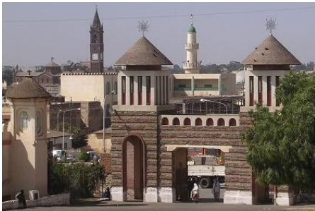
እንዳ ማርያም፡ አስመራ

ብተመሳሳሊ፡ ኣብ ገጠራት ኣብ ነፍሱ-ወክፍ ዓዲ፡ ዓሰርተ ጥራይ ኣገልግሎት ክህቡ ተፈቂድዎም። ዝተረፉ ዕድሚኦም ትሕቲ ሓሙሳ እንተኾይኑ ንወትሃደራዊ ታዕሊም ክብገሱ ተሓቢርዎም።